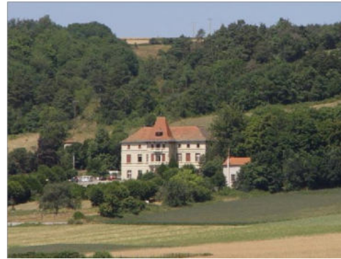
Au cœur du cratère d'Alleret, alt. 650m.